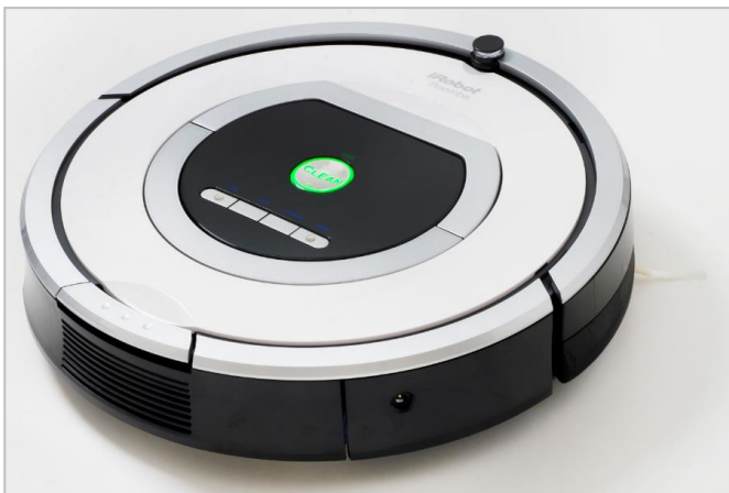
凸点シールを貼付したルンバ 視覚障がい者モデル イメージ

本製品の基本仕様は、ルンバ760をベースとし、日本点字図書館の監修を受け制作した音声取扱説明書を通常の取扱説明書に加えて同梱しました。さらに、本体操作ボタンやホームベース上には、確実な操作のために凸点を加えました。視覚に障がいのある方々には、従来品以上に使いやすくなっております。