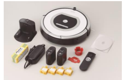
ルンバ 視覚障がい者モデル セット内容 イメージ