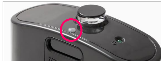
ホームベース(充電器) 凸点シールを貼付