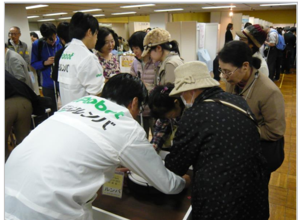
先日行われたサイトワールドでの展示の様子