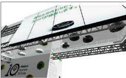
ルンバの吸引している様子が下から見える「ルンバ スカイウォーク」 ※イメージ