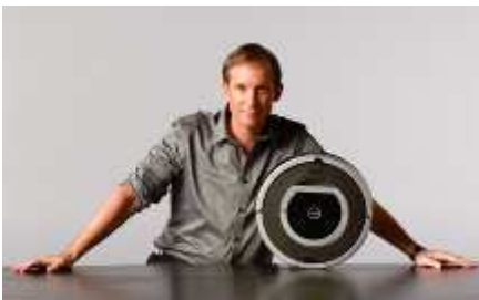
アイロボット社 CEO コリン・アングル

アイロボット社は、米国マサチューセッツ工科大学(MIT)で最先端の人工知能研究を進めていた科学者3人によって1990年に創立されたロボット産業のリーディングカンパニーです。以来、20年にわたり世界のロボット業界を牽引しています。研究者やエンジニアなど、ロボット工学におけるスペシャリストたちが所属する世界規模の企業として認められています。