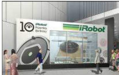
一般的なリビングを再現 ※イメージ